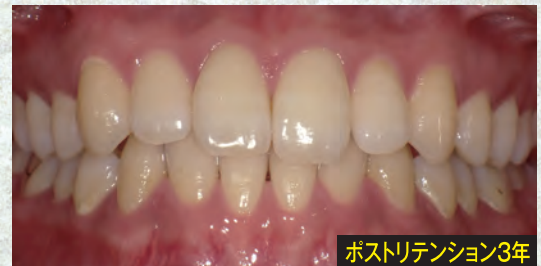
ポストリテンション3年